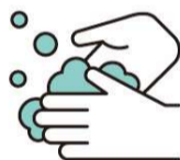
手洗い・うがいの励行