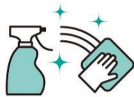
机、椅子、メニューなどの 定期的な消毒