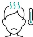
体調不良の場合は スタッフにお声がけください