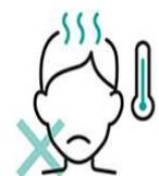
スタッフのこまめな体調チェック