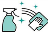
机、椅子、メニューなどの 定期的な消毒