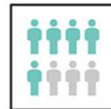
個室利用人数の制限

新型コロナウイルス感染拡大防止のため、スタッフは下記の対策をおこなっております。