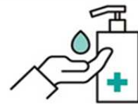
ご入店時、お客さまへ 消毒のご協力