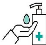
こまめな手先の消毒