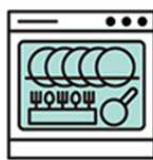
カトラリー・食器の 高温洗浄