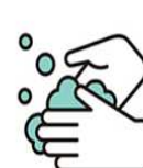
手洗い・うがいの励行