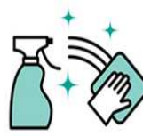
使用している備品類の定期的な消毒