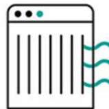
空気清浄機の追加設置 ※一部店舗