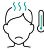
体調不良の場合は スタッフにお声がけください