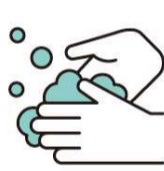
手洗い・うがいの励行