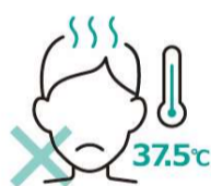
スタッフの体調管理

不特定多数が集まる集会、イベントや職場単位の集まりや会食などへの参加を自粛するよう指導しております。