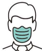
スタッフのマスク着用