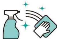
机、椅子、メニューなどの 定期的な消毒